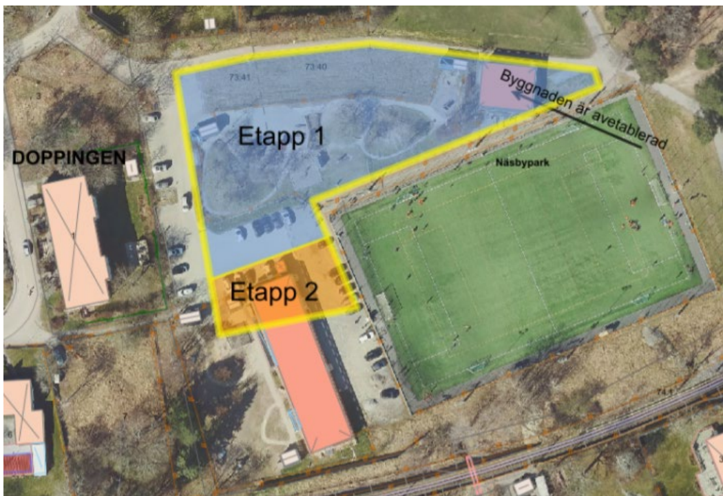
Figur 3 Etappindelning fastighetsbildning

Näsbylundens förskolas paviljong är belägen över den kommande fastighetsgränsen i söder. Eftersom en fastighetsgräns inte kan dras genom en befintlig byggnad, och eftersom verksamhet fortsatt ska bedrivas i paviljongen till inflytt i den nya förskolan, ska fastighetsregleringen ske i två etapper. Se figur 3 nedan.